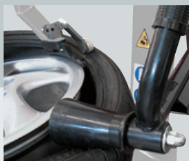
GA405.EL + PLUS 80CL (helper)